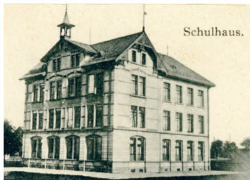
Zeitzeuge: Das 1894 erbaute Schulhaus «Hinterer Grund».

Spuren hinterlassen. Das Schulhaus ist sanierungsbedürftig.