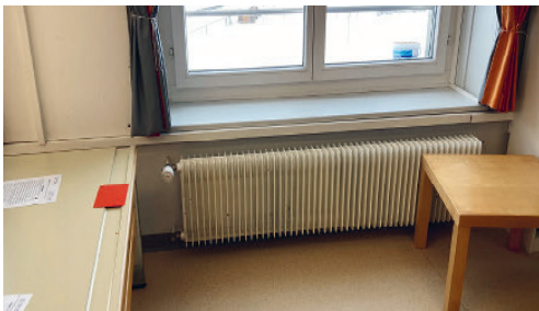
Über 50-jährige Heizkörper.

Etwa die Hälfte der Heizkörper sind über 50 Jahre alt. Die Toilettenanlagen werden über unregelmäßige vertikale Heizrohre beheizt. Diese Steigstränge und die Anschlüsse auf die alten Stahlradiatoren sind teilweise 50 Jahre und älter.