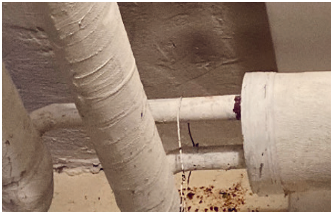
Sichtbare Korrosion bei alten Leitungen.

Teilweise sind die Leitungen und Dämmungen über 50 Jahre alt. Teils ist die Oberflächenkorrosion sichtbar und die Leitungen haben eine ungenügende Dämmstärke.