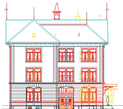
Ansicht Fassade Nord mit Farbschema (Farbliegende siehe unten).

Die Elektroinstallationen werden vollständig erneuert. Eine energieeffiziente LED-Beleuchtung sowie eine gestalterisch integrierte Leitungsführung tragen den zunehmenden Anforderungen durch die Digitalisierung des Unterrichts Rechnung.