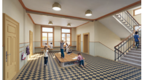
Visualisierung Vorraum Schulzimmer.

Weitere erhaltenswerte Bauteile wie das Treppenhaus mit Geländern, die Granit- und Holzstufen und der Plättliboden im Erdgeschoss werden instandgesetzt und wo nötig ergänzt.