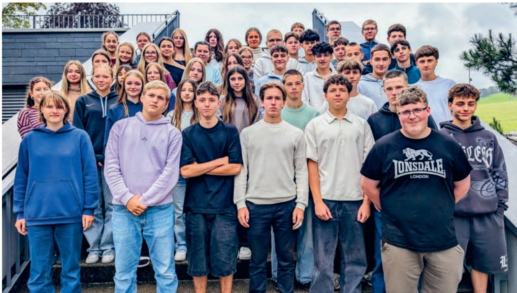
Für 47 Jugendliche endet die obligatorische Schulzeit zum Ende des Schuljahres 2025/26.

eine weiterführende Schule; 29 Schülerinnen und Schüler starten eine Berufslehre und neun Jugendliche besuchen ein Brückenangebot. Die Oberstufe Degersheim gratuliert allen Abgängerinnen und Abgängern zur erfolgreichen Suche einer Anschlusslösung oder zum Bestehen der Aufnahmeprüfungen. Sie wünscht ihnen für den weiteren Weg viel Erfolg, Freude und eine erfüllende Zukunft.