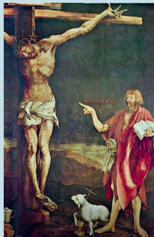
Isenheimer Altar, Johannes weist auf Jesus hin.