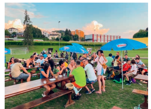
Das Badifest war ein rundum gelungener Sommeranlass bei perfekten Bedingungen.