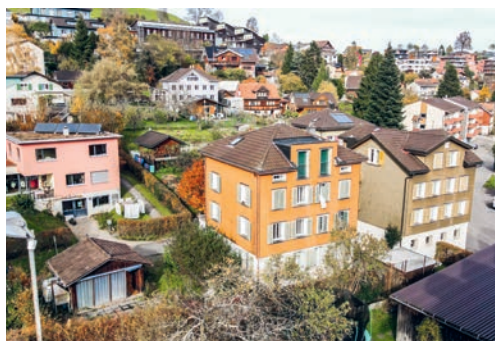
Die Gemeinde hat das Wohnhaus an der Steineggstrasse 27 verkauft.

DEGERSHEIM Der Gemeinderat Degersheim treibt seine Liegenschaftsstrategie weiter voran: Immobilien ohne Verwaltungsfunktion sollen mittelfristig verkauft werden, sofern sie ihre strategische Bedeutung verloren haben. Nun wurde das Wohnhaus an der Steineggstrasse 27 in Degersheim verkauft.