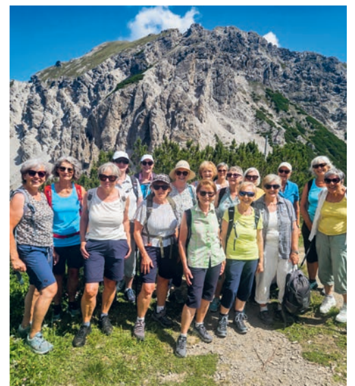
Turnerinnen FTV in Malbun-Sareis.