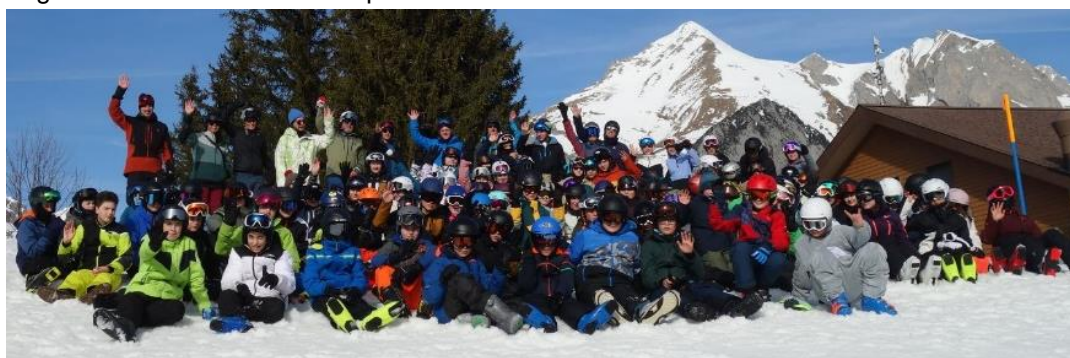
Ein ausführlicher Lagerbericht erscheint im Flade-Blatt.

Die gesamte 1. Oberstufe verbrachte die Woche vom 5. bis 9. Februar 2024 im Wintersportlager in Wildhaus. Rund 100 Jugendliche wurden dabei von verschiedenen Lehrpersonen sowie von privaten Leiterinnen und Leitern begleitet. Diese blicken auf viele schöne Erlebnisse auf den Ski- und Snowboardpisten sowie in den Lagerhäusern Oberdorf und Alpenblick zurück.