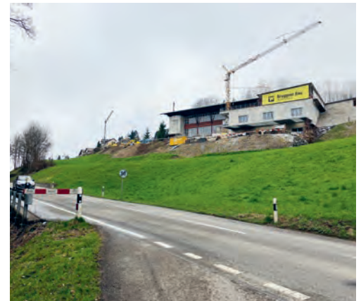
Der Seitenbach des Talbachs entsteht in der Grünau und kreuzt die Kantonsstrasse unterirdisch.

Sondernutzungsplan mit der Ausscheidung des Gewässerraums für den Seitenbach Talbach erarbeitet und den kantonalen Stellen zur Vorprüfung unterbreitet. Diese erachten den vorliegenden Sondernutzungsplan als genehmigungsfähig. Entsprechend hat der Gemeinderat an seiner Sitzung vom 5. März 2024 den Sondernutzungsplan erlassen und zur öffentlichen Auflage verabschiedet. Der Sondernutzungsplan Seitenbach Talbach und die zugehörigen Dokumente können vom 22. März bis zum 20. April 2024 in der Gemeinderatskanzlei oder auf der Website der Gemeinde, Rubrik «Politik → Sondernutzungsplan Seitenbach Talbach», eingesehen werden. Das dazugehörige Inserat finden Sie in dieser FLADE-Blatt-Ausgabe auf Seite 4.