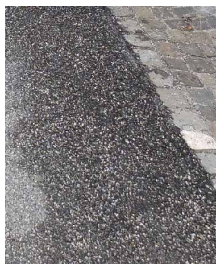
Deckbelag mit Kiesbeimischung/Rinne. Referenz Referenz Stättli Werdenberg.