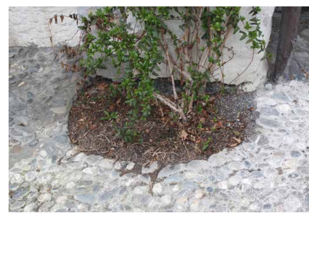
Beispiel Ausparung für private Bepflanzung.