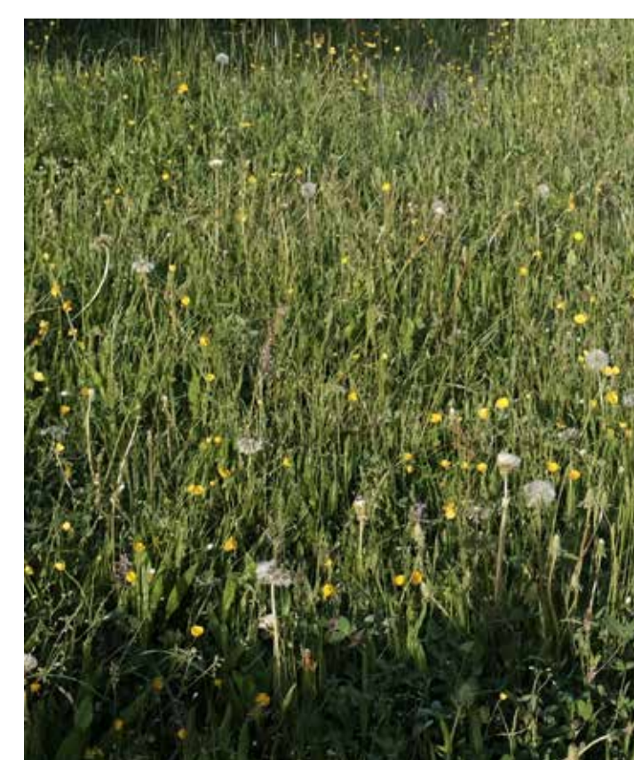
Wiese. Geeignet für Randbereiche an Gielenstrasse.