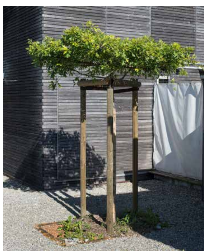
Kies: Referenz für private Bereiche Gielstrasse. Sumpfeichen bei Käsebrunnen.