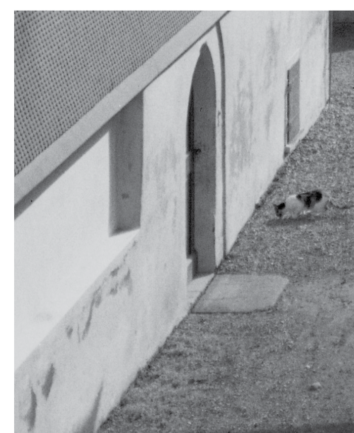
Referenz für Hauseingänge am öffentlichen Raum.