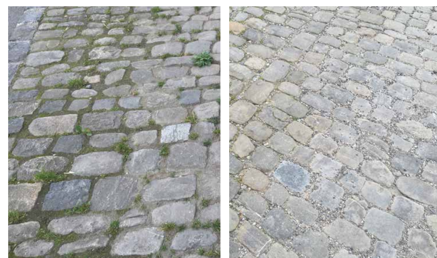
Pflasterung entlang von Bauten, in Sand verlegt.