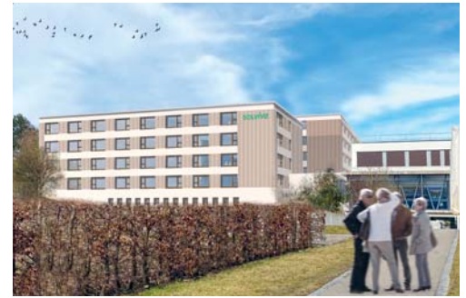
Solviva rechnet mit einem Investitionsvolumen von bis zu 35 Millionen Franken.

Alle Mitarbeitenden des Spitals Flawil haben die Möglichkeit erhalten, an den Standort St.Gallen zu wechseln. Die heute gemeinsam vom Spital und dem Wohn- und Pflegeheim Flawil betriebene Küche wird durch das WPH übernommen. Ein Teil des Küchenpersonals (rund zehn Mitarbeitende) wird deshalb durch das WPH weiterbeschäftigt.