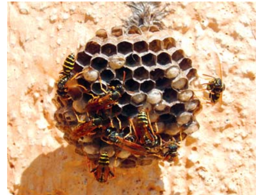
Wespennester sind keine Notfälle, wählen Sie darum nicht die Nummer 118.

Fällen weder um einen Notfall handelt noch die Feuerwehr zuständig ist, sollte nicht die Nummer 118 gewählt werden. In der Gemeinde Degersheim und Umgebung kann für die Entfernung von Wespen-, Hornissen- oder auch Bienennestern die Giger GmbH beigezogen werden. Die Giger GmbH ist über die Telefonnummer 071 371 16 43 oder per E-Mail an info@gigerdach.ch erreichbar.