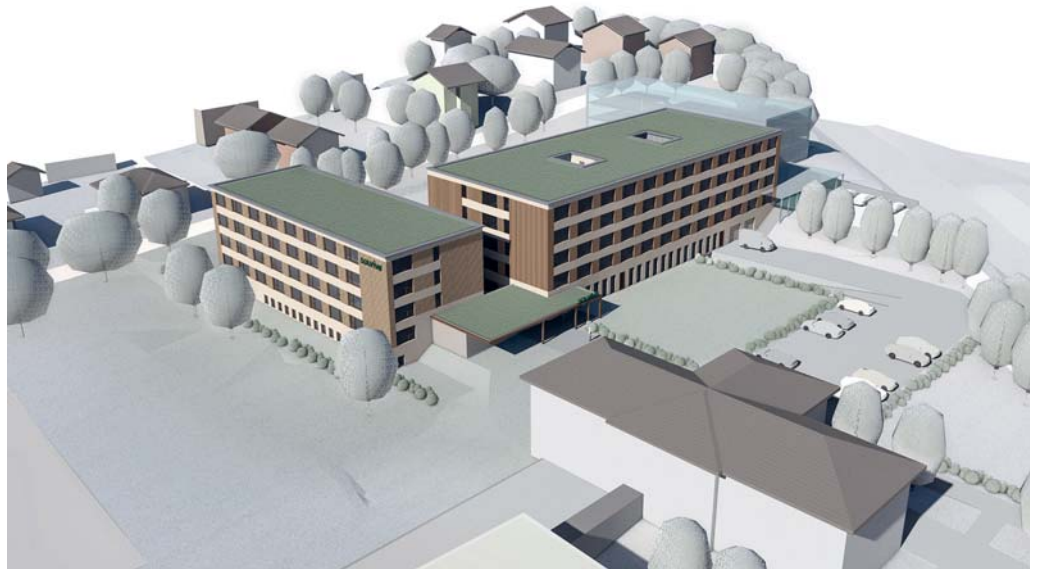
Visualisierung des Neubaus des Kompetenzzentrums für Gesundheit, Therapie und spezialisierte Langzeitpflege in Flawil.

Das Schweizer Paraplegiker-Zentrum Nottwil (SPZ) plant in Flawil den dritten SPZ-Aussenstandort – neben Bellinzona und Lausanne – für die ambulante Betreuung von querschnittgelähmten Personen sowie von Personen mit komplexen neurologischen Erkrankungen. Das vorgesehene Angebot kombiniert Leistungen des SPZ sowie der weiteren Gesellschaften der Schweizer Paraplegiker-Gruppe. Der Fokus liegt auf der wohnortnahen ambulanten Beratung und Behandlung von spezi-