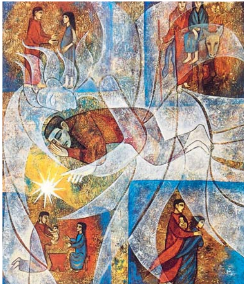
Maiandachten – mit dem heiligen Josef.

KIRCHE In ihren Abendlobfeiern möchte die Seelsorgeeinheit Magdenau (Sema) in Gemeinschaft einzelne Eigenschaften des heiligen Josefs näher betrachten. Maiandachten mit dem heiligen Josef als Vater? Das ist ungewohnt – und doch auch natürlich. Maria war begleitet von ihrem Verlobten. Im Ringen miteinander und mit Gott sind beide gewachsen, als Mann und als Frau, als Mutter und als Vater. Der liebende Blick auf Maria, die von Josef begleitet wird, stärkt die Teilnehmenden in der Nachfolge Jesu. Sonntag, 2. Mai 2021, um 19 Uhr in der Kapelle der kath. Kirche St. Jakobus in Degersheim. eing.