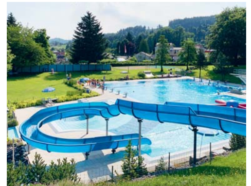
Das Schwimmbad Degersheim startet am 15. Mai 2021 in die Sommersaison.

Der Schnee ist weg, das Wasser eingefüllt. Alles steht bereit für eine tolle Badesaison 2021. Die grosse Spiel- und Liegewiese mit Bäumen, die Schatten spenden, das Wasserbecken mit Rutschbahn und Sprungturm sowie ein Beachvolleyballfeld bieten Spass und Erholung für Gross und Klein. Das Schwimmbad ist bei trockener Witterung und Lufttemperaturen von 16°C täglich geöffnet. Über die Öffnung des Schwimmbades wird täglich um 8.00 und 12.00 Uhr aufgrund der Wetterangaben von Meteo Schweiz entschieden. Der Entscheid wird auf der Website der Gemeinde in der Rubrik «Freizeit → Freibad» kommuniziert. Saisonkarten können bereits jetzt beim Einwohneramt der Gemeinde erworben werden. Im Schwimmbadkiosk werden Sie auch in diesem Sommer von Gabriela Hug und ihrem Team bedient. Als Restaurantgast fürs Mittagessen oder für eine Pausenverpflegung sind Sie herzlich willkommen.