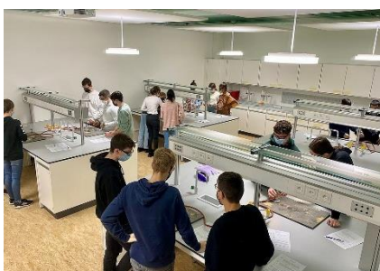
Die neuen Arbeitsplätze