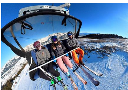
Das Wintersportlager in Wildhaus...