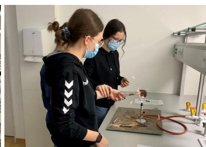
Ein Chemie-Experiment aus der Nähe

Das neue umgebaute naturwissenschaftliche Labor im Trakt 3 durfte Ende des vergangenen Jahres in Betrieb genommen werden. Modern eingerichtete Arbeitsplätze machen Lust aufs Experimentieren. Mit dem separaten Vorbereitungsraum konnte auch die Situation für die Lehrpersonen merklich optimiert werden.