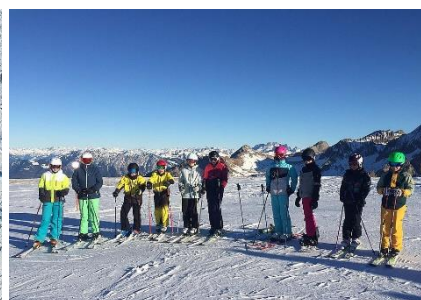
und herrlichem Wetter!