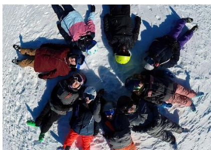
punktete mit guter Stimmung...